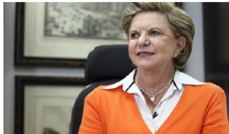
Ex-senadora Lúcia Vânia