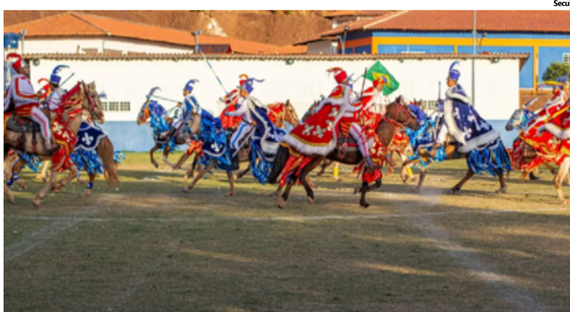
Municípios preservam tradições centenárias de um dos eventos culturais mais representativos do estado

"Em Corumbá, a cidade associa o fluxo turístico ambiental ao cultural e realiza uma grande celebração com ganhos para todo o sistema hoteleiro, de pousadas, res-