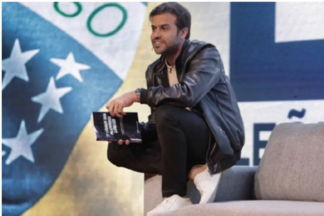
Pablo Marçal: sem Lula em 2026, empresário admite concorrer ao Planalto

“Sobre o Tarcísio, a minha opinião sincera é que ele é neu-