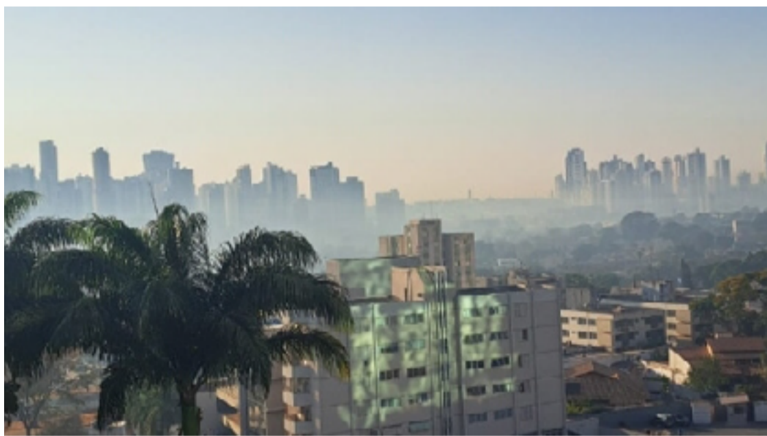
Em cenário de calor, fumaça e baixa umidade, população deve beber bastante água e evitar exposição ao sol

Entre as principais recomendações estão: beber bastante água, mesmo sem sentir sede (sucos naturais e chás também são ótimas opções); evitar exposição ao sol (nos horários mais quentes do dia, entre 10h e 16h, permanecer em ambientes frescos e ventilados); ao sair de casa, usar protetor solar com fator de pro-