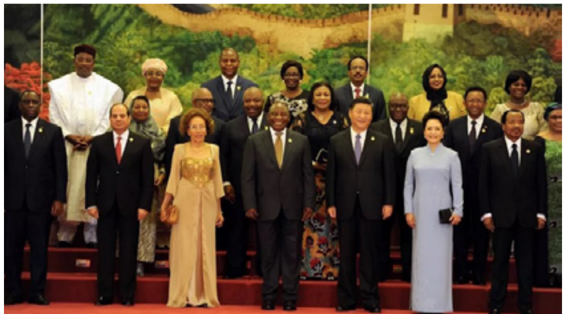
Cúpula, que ocorre a cada três anos, reúne representantes de alto nível de países africanos e da China

Apesar dessas questões, a China continua a enfatizar seu compromisso com a África. O Ministério das Relações Exteriores chinês declarou que o país “sempre considerou o desenvolvimento da África como