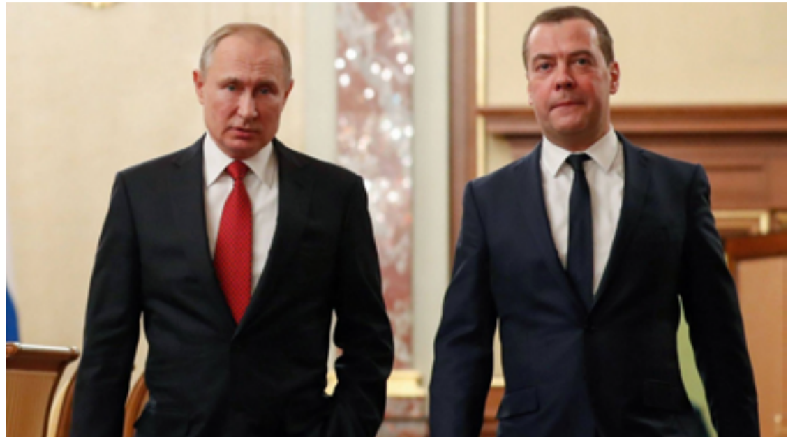
Visita de Putin à Mongólia é vista como um desafio ao TPI e à comunidade internacional

A visita de Putin à Mongólia é vista como um desafio ao TPI e à comunidade internacional. Especialistas apontam que o