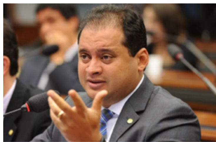
Weverton Rocha: proposta polêmica no plenário do Senado

Durante a discussão, Weverton —que integra a base de Lula— afirmou que precisava “azeitar” o apoio dos colegas que estão em seu campo político e negou que o projeto tenha avançado no Senado para favorecer Bolsonaro.