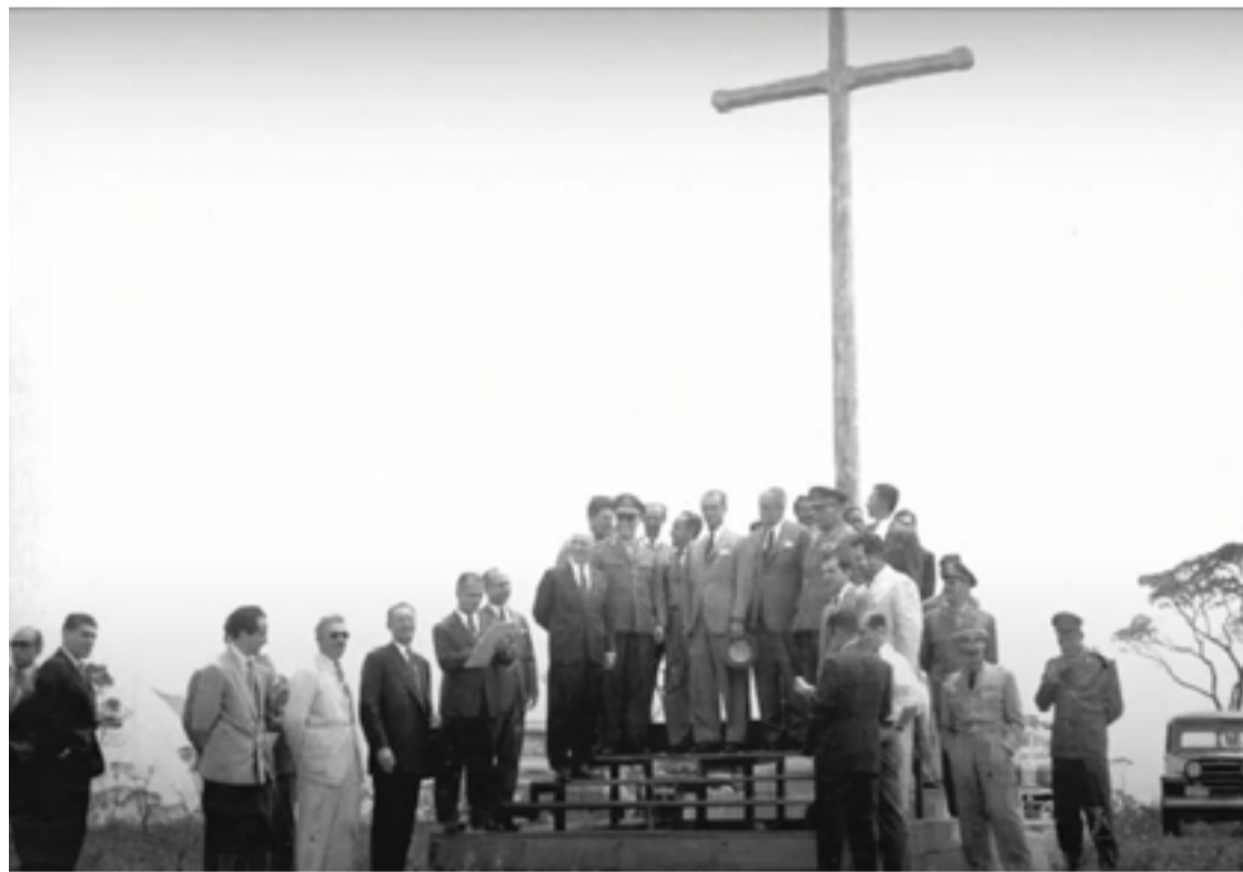
Personalidades: ministros e políticos no local do que viria a ser Brasília