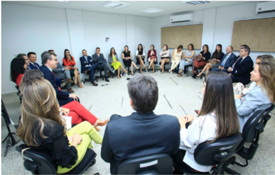
A estruturação do Ministério Público na região foi o destaque durante a conversa

A coordenadora das promotorias de Justiça de Valparaíso