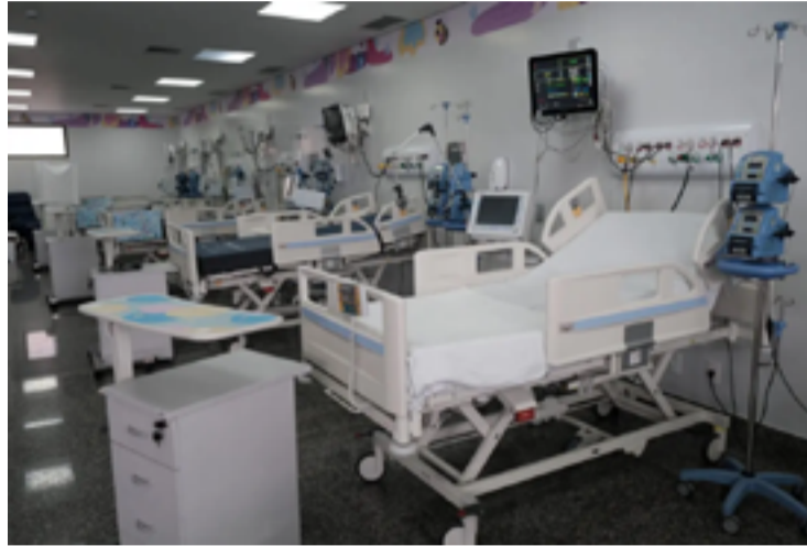
Leitos pediátricos e neonatais do Hecad ajudaram a suprir demanda que o Estado possuía

Além dos leitos próprios, a SES-GO também contratualiza outros em unidades de