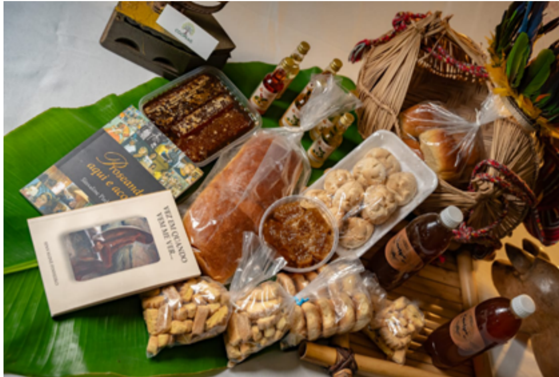
Evento será realizado de 7 a 9 de setembro, iniciativa tem apoio da Secretaria de Estado da Cultura por meio do Programa Goyazes