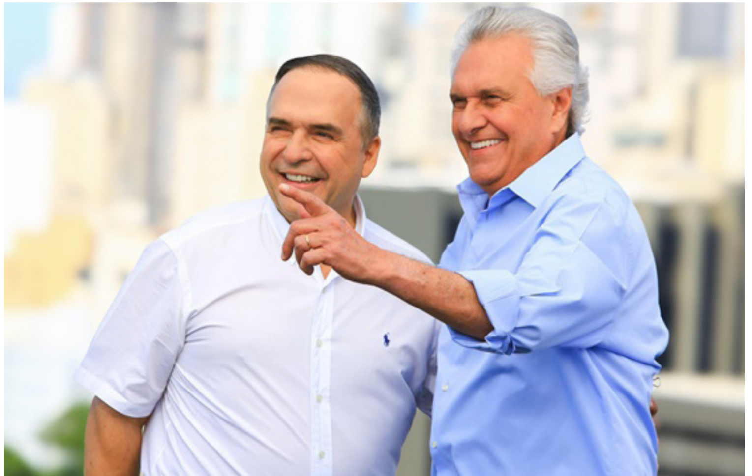
Ronaldo Caiado e Sandro Mabel: campanha propositiva já motiva o eleitorado goianiense

Goiânia pode estar, portanto, presenciando nesta semana uma virada, cuja origem seria a grande exposição do governador Ronaldo Caiado na campanha de Mabel a partir da propaganda televisiva e visitas a pontos estratégicos da Capital. Considerado o governador mais bem avaliado do Brasil, Caiado é o grande fiador de Mabel. O conteúdo massificado no horário eleitoral parece