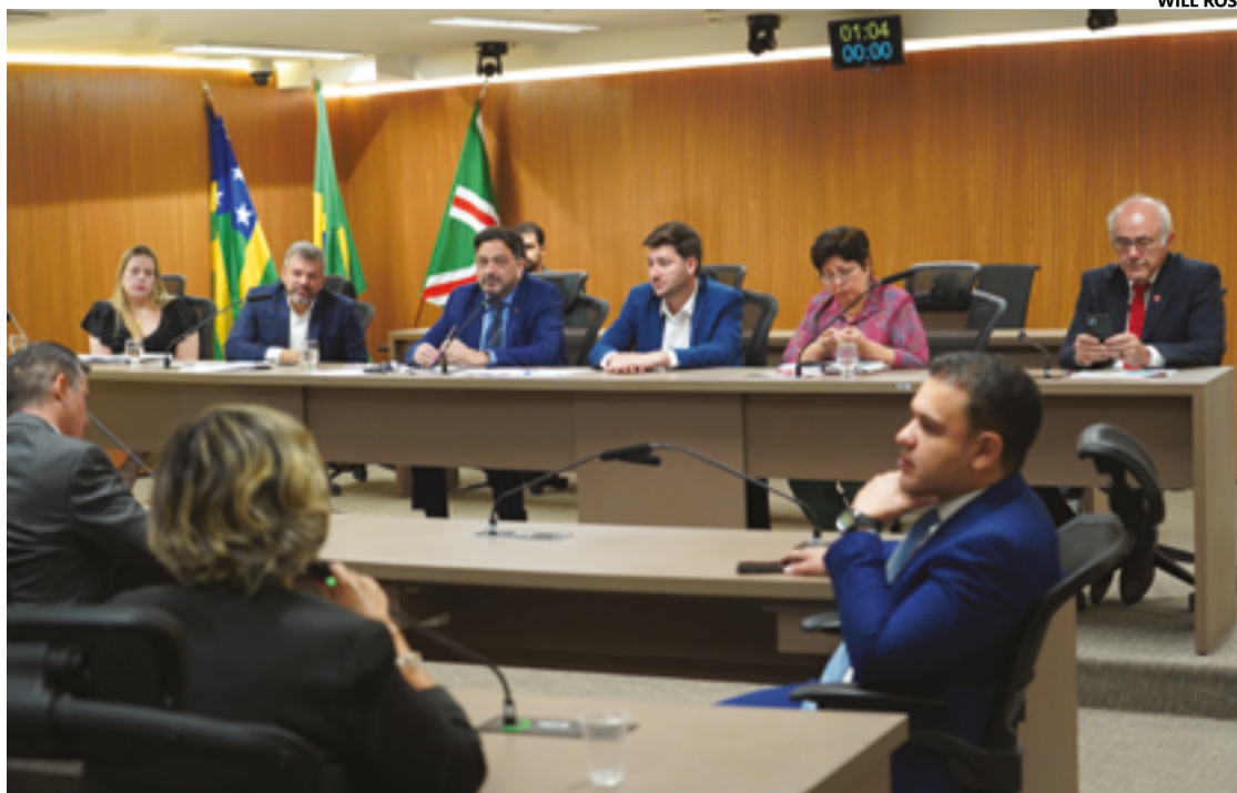
Audiência pública realizada na Alego discutiu as recentes mudanças no funcionamento do Serviço Social Autônomo de Assistência à Saúde dos Servidores Públicos e Militares do Estado de Goiás (Ipasgo Saúde)

O crescimento e a expansão do plano, disse o presidente do Ipasgo Saúde, fazem com que o instituto agora se posicione como a maior autogestão do Brasil em termos de número de beneficiários. O gestor também abordou os desafios enfrentados, como a necessidade de adequação às normas da Agência Nacional de Saúde Suplementar (ANS) e as medidas