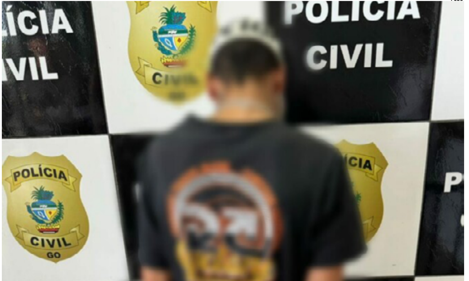
O suspeito foi imediatamente conduzido à Delegacia de Polícia de Cristalina, onde foi formalizado o procedimento de prisão

No relato feito à polícia, a mulher descreveu que, no mesmo dia, foi novamente perseguida pelo autor das agressões. Durante a perseguição, o homem a ameaçou e a agrediu fisicamente, aplicando-lhe uma "rasteira". Diante da gravidade dos fatos narrados, a equipe policial agiu rapidamente, deslocando-se até a residência do suspeito.