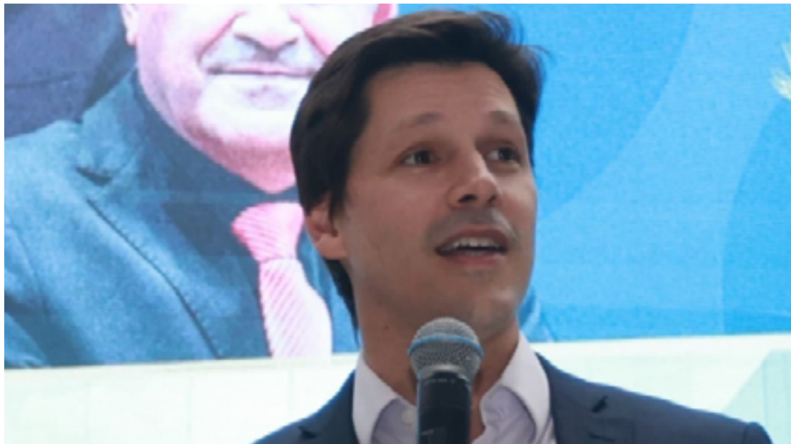
Daniel Vilela, governador em exercício, é entusiasta do uso racional da tecnologia para desburocratizar estado: gestor anuncia hoje PAT-e

Os impactos das digitalizações têm sido comparados aos efeitos de políticas públicas originadas com a racionalização pública do governo Mauro Borges (1961-1964), quando Goiás modernizou sua estru-