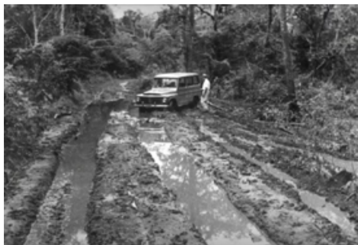
Sem estrada: fotógrafo mostra dificuldade para acessar BSB

local do que seria construída a capital federal. O primeiro no mundo! A partir daquele dia, eu fiz um propósito comigo: vou fazer um filme